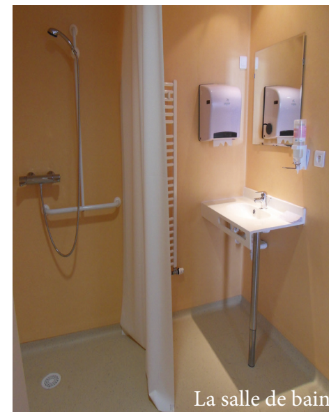
La salle de bain

Auprès de l'agent du kiosque 15 jours avant.