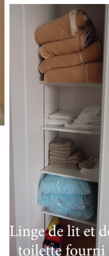
Linge de lit et de toilette fourni