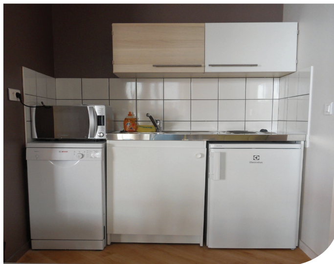
Une cuisine équipée (réfrigérateur, four à micro-ondes, lave vaisselle...) pour préparer vos repas.

Possibilité de réserver vos repas de midi et soir auprès de l'agent du kiosque