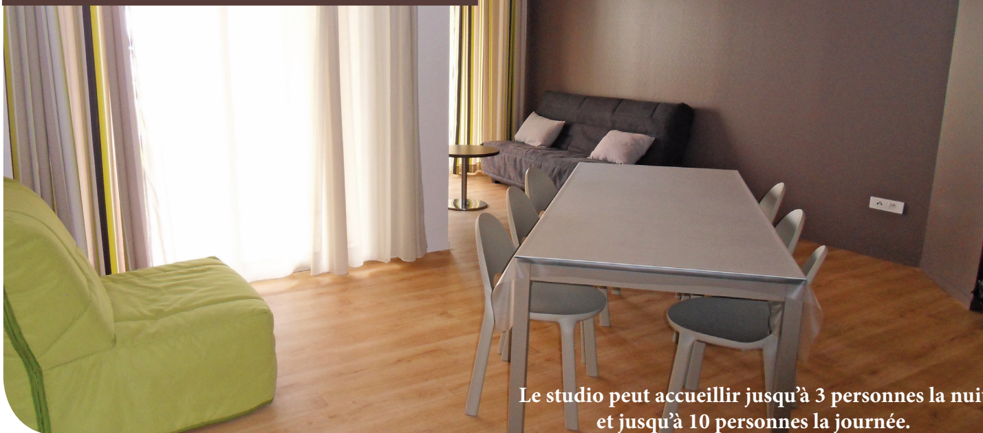
Le studio peut accueillir jusqu'à 3 personnes la nuit et jusqu'à 10 personnes la journée.

Possibilité de réserver vos repas de midi et soir auprès de l'agent du kiosque